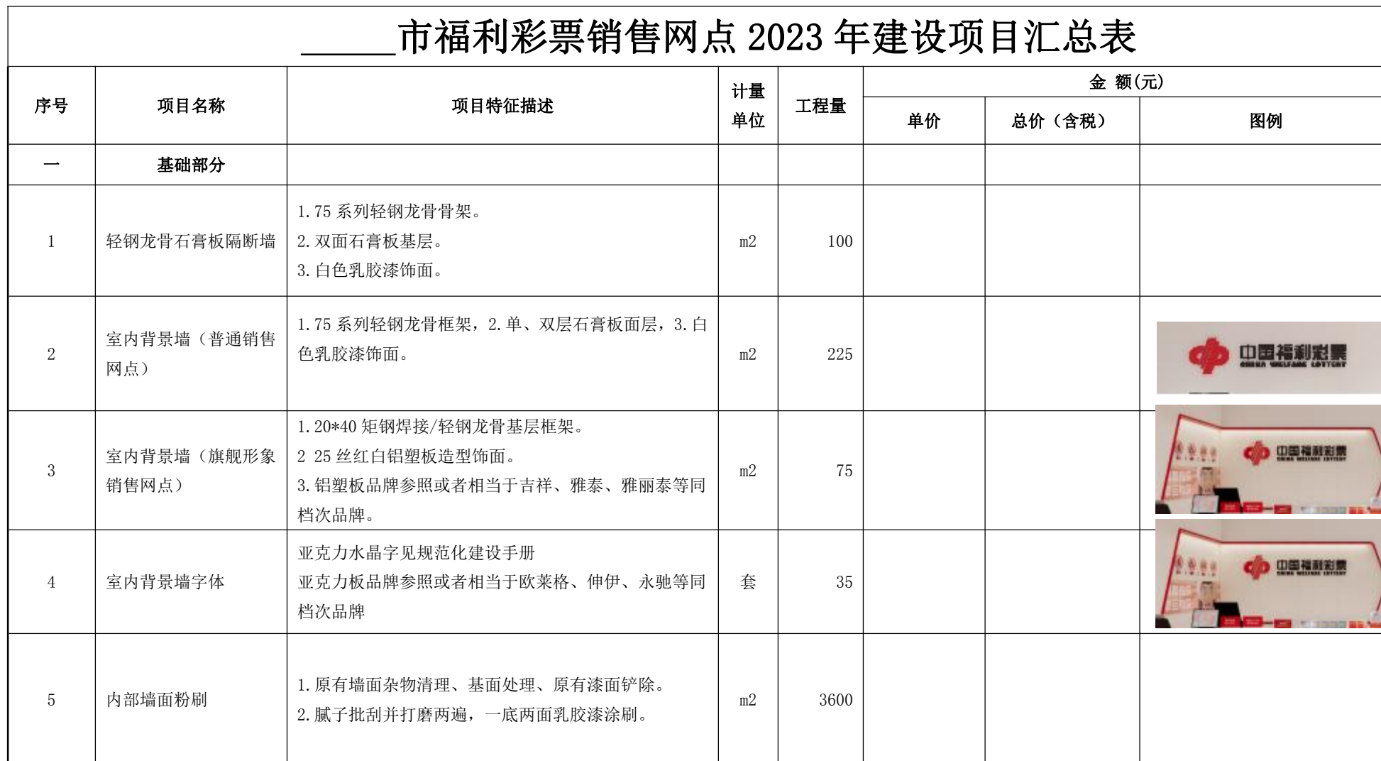
____市福利彩票销售网点 2023 年建设项目汇总表